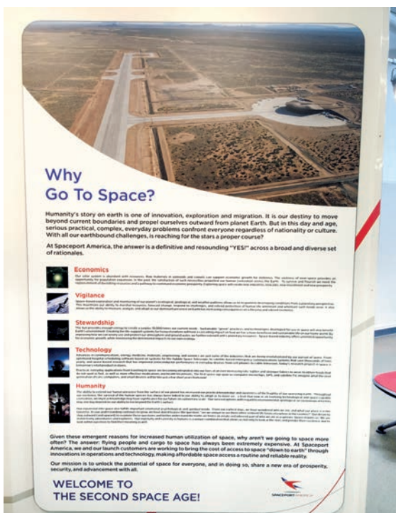
Рис. 1. Экспозиция “Зачем лететь в космос?”. Космопорт “Америка”, Нью-Мексико.

Например, космопорт “Америка” (см. Рис. 1) определил причины, по которым мы должны полететь в космос, следующим образом: на первом месте экономика,