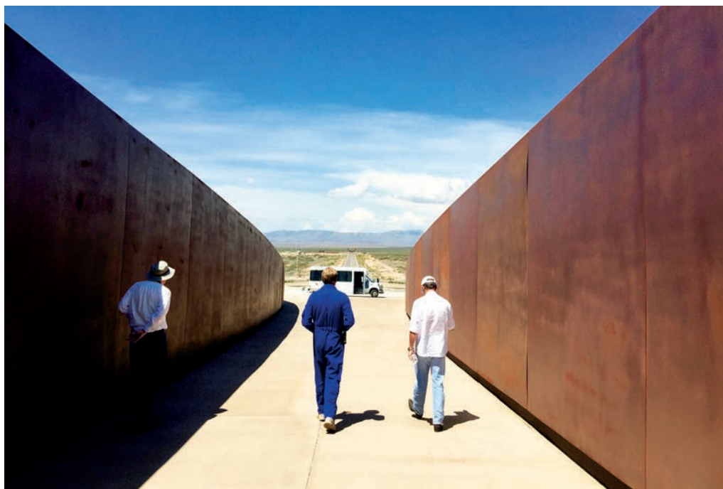
Рис. 2. Экскурсовод космопорта “Америка” (в центре).

на последнем человечество. Можно утверждать, что в 1950–1960-х годах приоритеты NASA выстраивались в обратном порядке. Действительно, добро пожаловать во “вторую космическую эру”!..