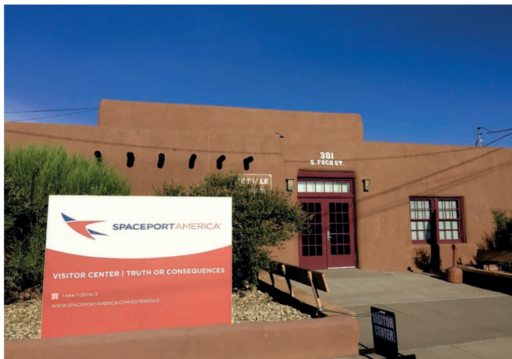
Рис. 4. Центр для посетителей космопорта “Америка”.

находится где-то в поясе астероидов ( Luscombe 2018). Что еще более важно, язык, который И. Маск использовал, говоря о распространении человечества с поверхности Земли, уходит корнями в колониализм ( Lee 2015). И основатель “SpaceX” в этом не одинок.